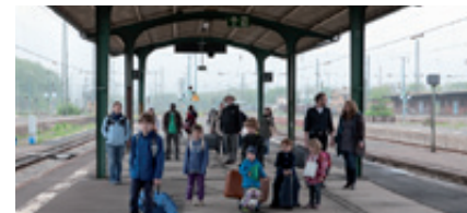
TITELBILD HAUPTBAHNHOF KASSEL