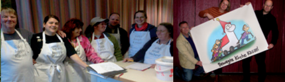
Bewegte Kirche Kassel