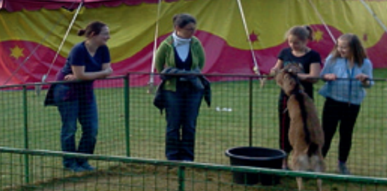
St. Laurentius: Mitmachzirkus auf der Kirchenwiese | St. Joseph: Helferteam Sozialakirche