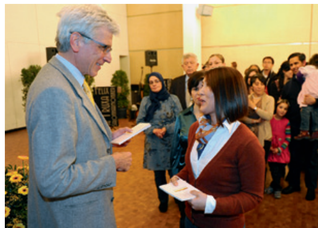
Oberbürgermeister Bertram Hilgen als Gastgeber bei der Einbürgerungsfeier

Wir freuen uns auf Ihre Antworten an mittendrin@katholische-kirche-kassel.de oder im Internet-Forum auf www.katholische-kirche-kassel.de/forum . Selbstverständlich geht es auch per Brief an Redaktion [mittendrin], Pastoralverbund Kassel Mitte, Ihringshäuser Straße 3, 34125 Kassel.